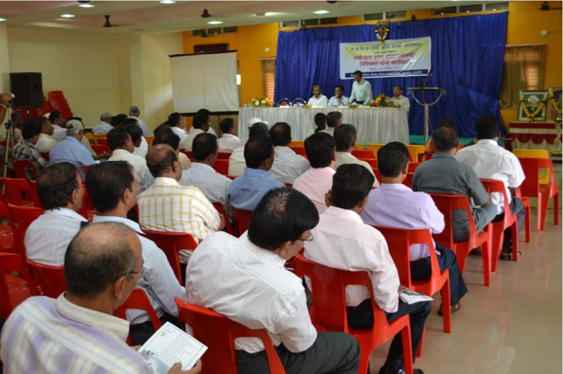
मजनिप्रा व वाल्मी यांनी पाणी वापर हक्कदारी व विनियम यावर दि. २४/११/२०११ रोजी आयोजित केलेली रत्नागिरी विभागीय कार्यशाळा

Nagpur Regional Workshop on Water Use Entitlement & Regulation on date 17/09/2011 organised by the MWRRA & WALMI