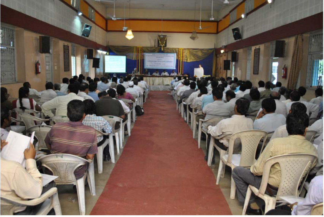
मजनिप्रा व वाल्मी यांनी पाणी वापर हक्कदारी व विनियम यावर दि. १७/०९/२०११ रोजी आयोजित केलेली नागपूर विभागीय कार्यशाळा

Nagpur Regional Workshop on Water Use Entitlement & Regulation on date 17/09/2011 organised by the MWRRA & WALMI